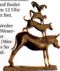
Die Bremer Stadtmusikanten

5. Passage ohne Wiederkehr: Über sieben Millionen Menschen begannen in Bremerhaven ab dem 19. Jahrhundert ihre Reise nach Übersee. In der rekonstruierten Warthalle der Reederei Norddeutscher Lloyd entstand das Erlebniszentrum Deutsches Auswandererhaus. Columbusstr. 65, www.dah-bremerhaven.de . Geöffnet: So bis Fr 10–18, Sa 10–19 Uhr.