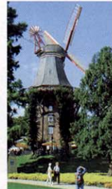
Mühle am Wall

2. Nicht nur für Brautpaare: Das Hochzeitshaus im Schnoor (Wüste Stätte 5), hat nur 43 Quadratmeter auf drei Etagen – aber mit Whirlpool. 321 Euro kostet die Nacht für ein Paar, Sektfrühstück mit Lachs und Krabben inbegriffen. Buchungen unter Tel. 0170/4618333. Im Internet: www.hochzeitshaus-bremen.de