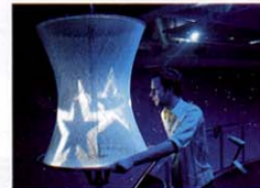
Sonne, Mond und Sterne – Entdecker im „Universum“.

1. Spielend lernen: 4 000 Quadratmeter Ausstellungsfläche laden im Science Center Universum zu Rundgängen ein. Wie fühlt sich der Urknall an, wie ein Erdbeben, wenn man auf der Couch sitzt? Wiener Str. 2, 12 Euro (erm. 8), www.universum-bremen.de . Geöffnet: Mo bis Fr 9–18, Sa/So 10–19 Uhr.