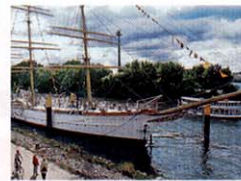
Ahoi: „Schulschiff Deutschland“.

3. Wo Matrosen lernen: Das „Schulschiff Deutschland“ ankert in Bremen-Vegesack. Es ist das einzig erhaltene gebliebene Segelschulschiff der Handels-schiffahrt, das ausschließlich zu Ausbildungszwecken gebaut wurde (1927, Bremerhaven). Noch heute sticht es in See. Zum Alten Speicher 15. www.schulschiff-deutschland.de